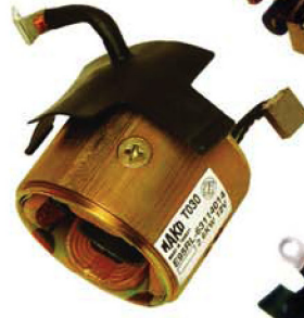
● Yoke Assembly Komple Karkas (Gövde)