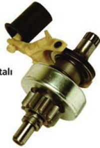
● Fork Lever Komple Kavrama Grubu Çatalı