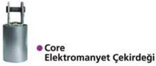
● Core Elektromanyet Çekirdeği