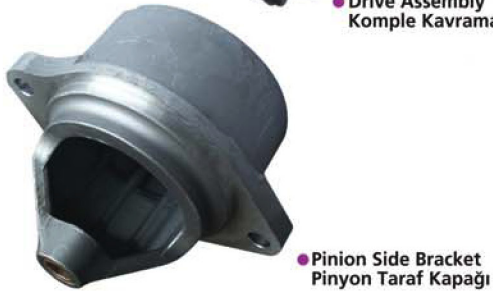
● Pinion Side Bracket Pinyon Taraf Kapağı