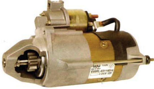
● E95RL 2.6 KW / 12V Gear Reduction Redüktörlü BOXER, DUCATO, JUMPER