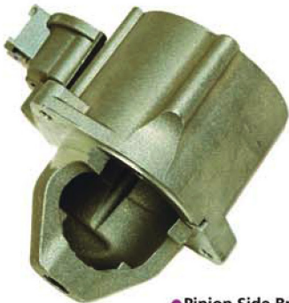
● Pinion Side Bracket Pinyon Taraf Kapağı