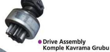
● Drive Assembly Komple Kavrama Grubu