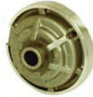
● Reduction Gear Box Komple Redüktör Grubu