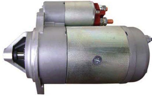
● MT71 Marş Motoru 12V / 2.5 KW MT71 Starter Motor 12V / 2.5 KW