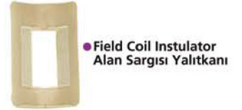
● Field Coil Insulator Alan Sargısı Yalıtkanı