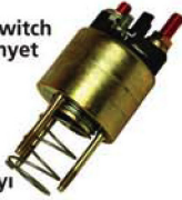
● Spring Elektromanet Yayı