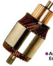
● Armature Endüvi