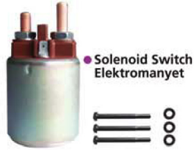
● Solenoid Switch Elektromanyet